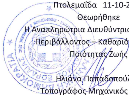
Ηλιάννα Παπαδοπούλου Τοπογράφος Μηχανικός με β. Α'

Η Αναπληρώτρια Διευθύντρια της Δ/σης Περιβάλλοντος – Καθαριότητας και Ποιότητας Ζωής