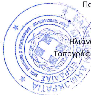
Ηλιάνα Παπαδοπούλου Τοπογράφος Μηχανικός με β. Α'

Η Αναπληρώτρια Διευθύντρια της Δ/σης Περιβάλλοντος – Καθαριότητας και Ποιότητας Ζωής