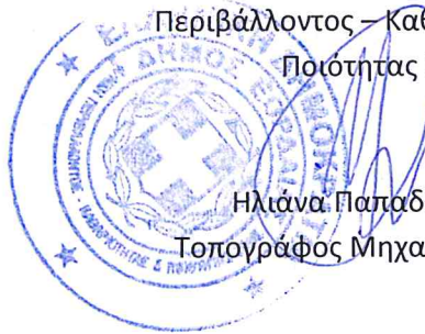
Ηλιάνα Παπαδοπούλου Τοπογράφος Μηχανικός με β. Α'

Η Αναπληρώτρια Διευθύντρια της Δ/νσης Περιβάλλοντος – Καθαριότητας και Ποιότητας Ζωής