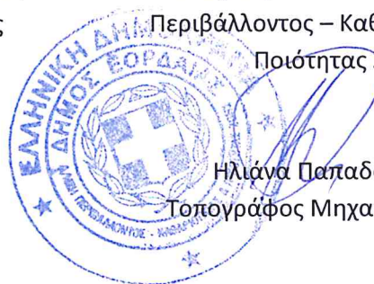
Ηλιάννα Παπαδοπούλου Τοπογράφος Μηχανικός με β. Α'

Η Αναπληρώτρια Διευθύντρια της Δ/σης Περιβάλλοντος – Καθαριότητας και Ποιότητας Ζωής