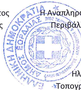
Ηλιάννα Παπαδοπούλου Τοπογράφος Μηχανικός με β. Α΄

Η Αναπληρώτρια Διευθύντρια της Δ/σης Περιβάλλοντος – Καθαριότητας και Ποιότητας Ζωής