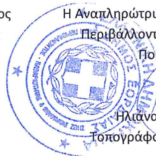
Ηλιάνα Παπαδοπούλου Τοπογράφος Μηχανικός με β. Α΄

Η Αναπληρώτρια Διευθύντρια της Δ/νσης Περιβάλλοντος – Καθαριότητας και Ποιότητας Ζωής